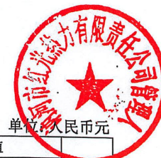
房屋建筑物清查评估明细表