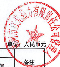
车辆清查评估明细表