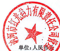
机器设备清查评估明细表