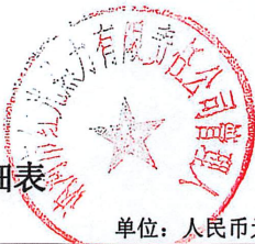
土地使用权清查评估明细表