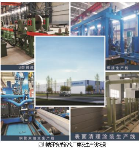
四川瑞泽杭萧钢构厂房及生产线场景

司年生产能力达 30 万吨，主要产品包括绿色建筑材料钢管束、钢筋桁架楼承板、H 型钢梁、箱型柱、十字柱及次构件等。